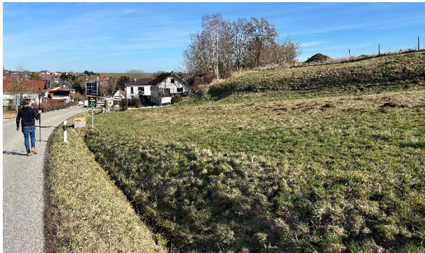
Abbildung 4 Planungsgebiet