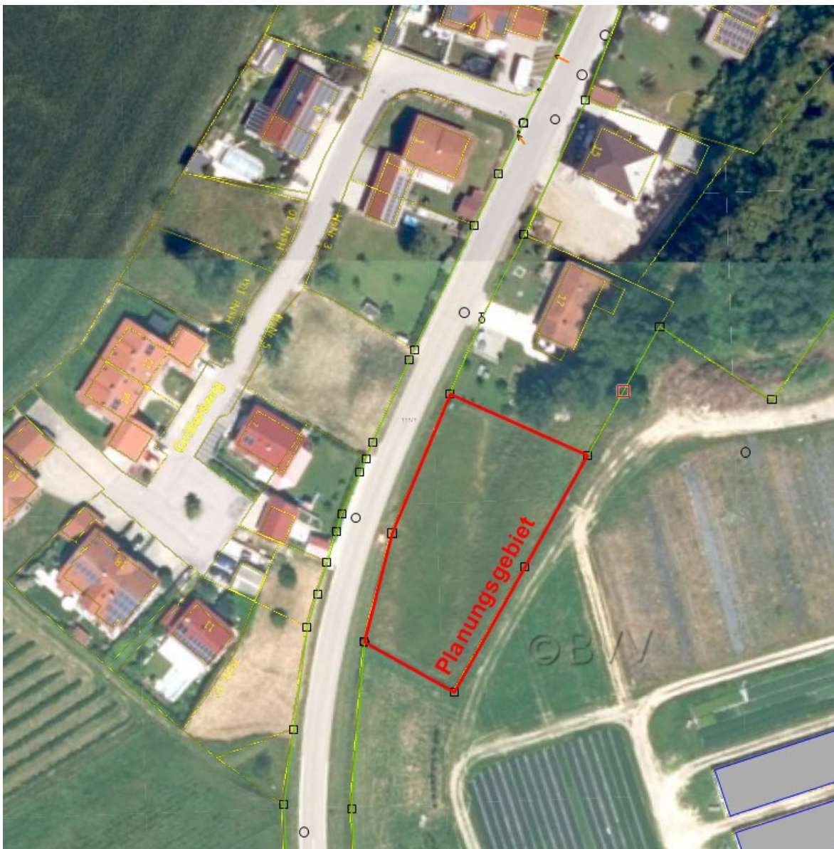
Abbildung 3 Anknüpfung des Planungsgebietes