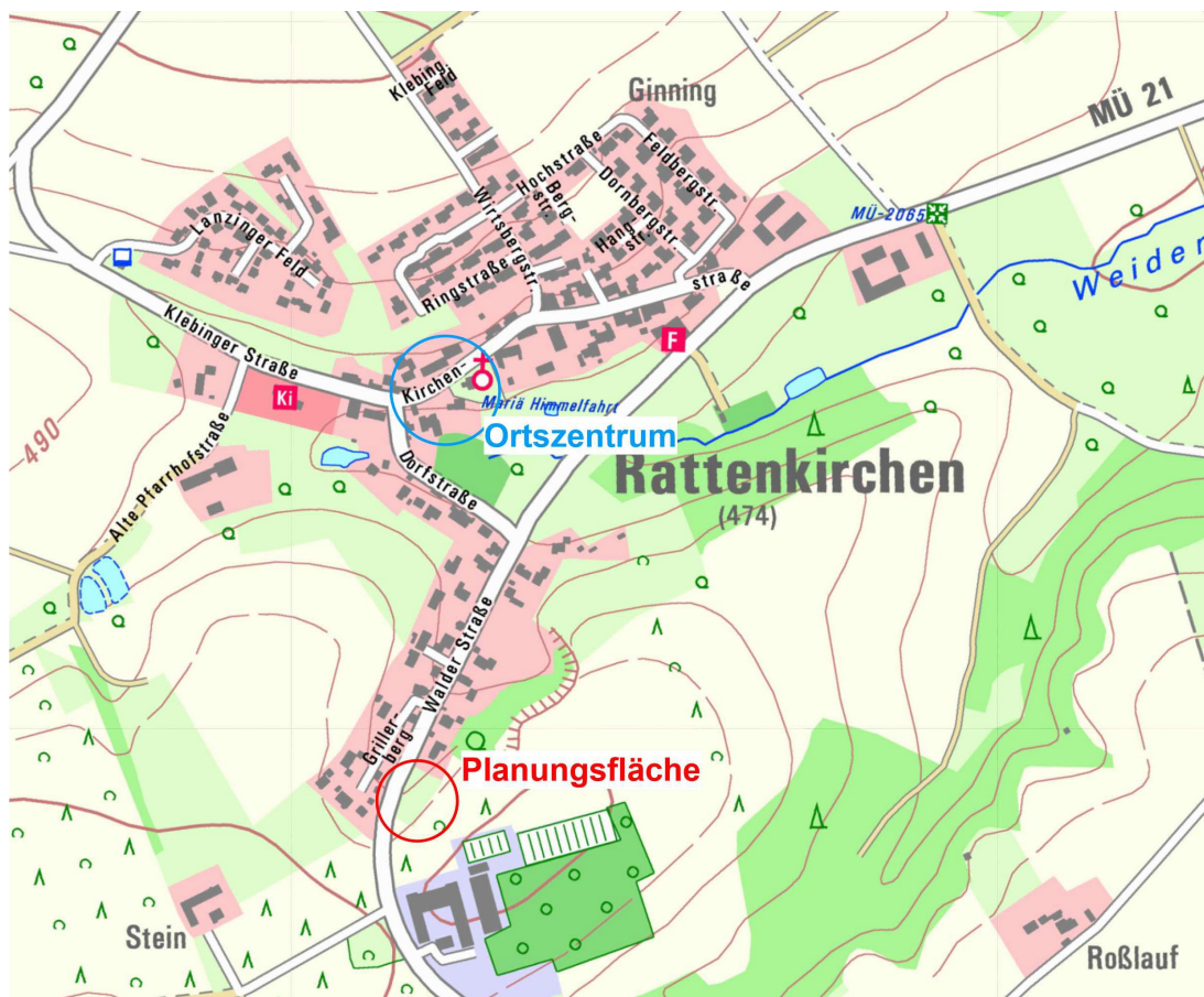
Abbildung 1 Lage des Planungsgebiets