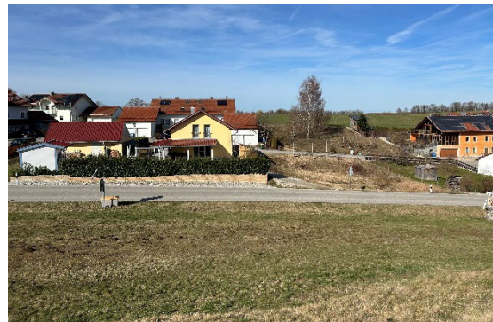
Abbildung 5 Vorhandene Bebauung (ggü. Plangebiet)